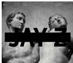
JAY-Z „MAGNA CARTA HOLY GRAIL”