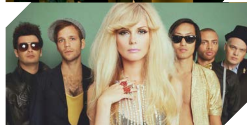
The Asteroid Galaxy Tour