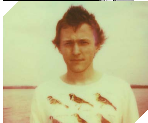
Patrick The Pan